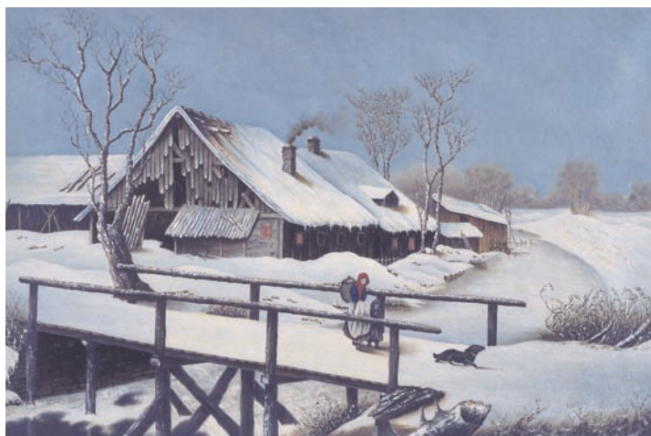
徳川慶喜筆「西洋雪景図」

様々な種類の資料 … 資料の種類（紙、染織、科学機器ほか）に応じて専門の修復家や職人の方々と相談し、最適な方法を検討して修理・修復を行う（例えば、油絵の破れや汚れを修復・クリーニングするなど）。