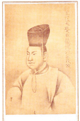
No.17 徳川家茂肖像画写真

春嶽や春嶽を中核とする福井藩の藩論と呼応同調し、幕政改革やわが国の近代化を推し進めた志士や同士たちの事跡を特に七人の関係史料を展観しました。