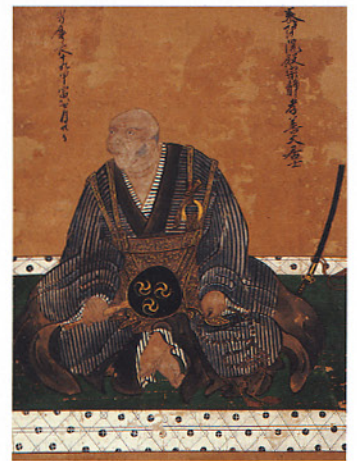
結城晴朝肖像画 (結城市 孝顕寺蔵 茨城県指定文化財)

慶長5年(1600)関ヶ原の戦いには参加しませんが、関東で上杉景勝などの押さえとして充分役割を果たしました。