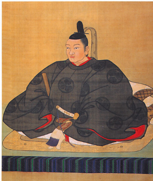
結城秀康肖像画 (運正寺蔵)

当展では、結城秀康に関わる古文書や記録、遺品など40点余の資料を展覧して、秀康の生涯や事績を紹介するとともに、その遺徳を偲びたいと思います。