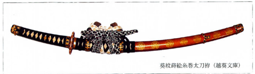
葵紋蒔絵糸巻太刀拵（越葵文庫）

江戸幕府では、正式な場所での服装やしきたりが細かく定められており、刀もその中の重要な要素の一つでした。特に大名が正装した時に携えることを定められたものに、「糸巻太刀」があります。糸巻太刀は室町時代後期に生まれた儀仗（儀式で身につける刀）用の太刀です。展示品は蒔絵の技法をこらし、さらに各所に入念な細工の金具が付属した豪華なものです。葵紋以外にも様々な家紋をつけた各大家の糸巻太刀拵が現存しますが、中でも葵紋のものが多いのは、大名が身に付ける以外に將軍家への献上品、あるいは將軍家からの拝領品として贈答されることが多かったからだといわれます。まさにハレの場において武家の象徴を飾る一品といえます。