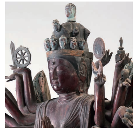
千手観音立像 越前市余川神明神社