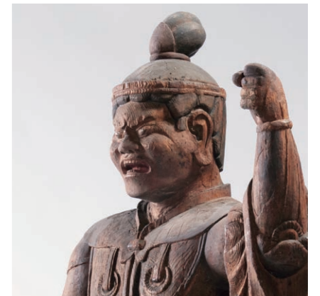
広目天像 福井市二上観音堂