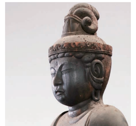
聖観音立像 坂井市三国町円海寺