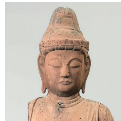
聖観音立像 越前市領家八幡神社