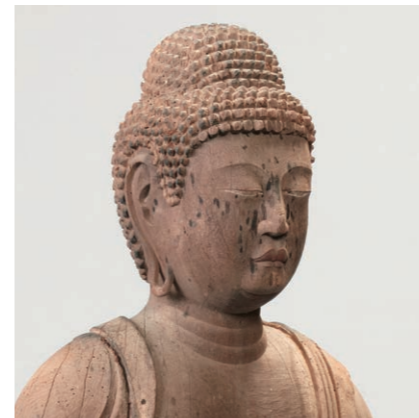
薬師如来立像 福井市高尾薬師神社