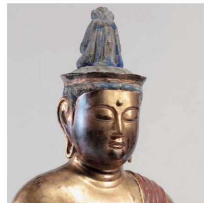
聖観音坐像 越前市味真野神社