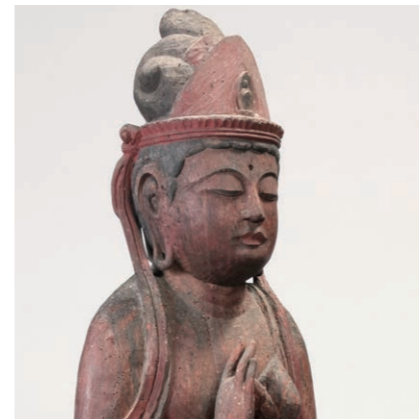
聖観音立像 越前市荒谷観音堂

本展では、泰澄大師が白山を開山したとされる養老元年から平成29年で1300年になるのを記念し、白山遥拝の地や文殊山・日野山など在地の霊山周辺に祀られる仏像を一堂に展示し、この地における人々の信仰の歴史を紹介していきます。