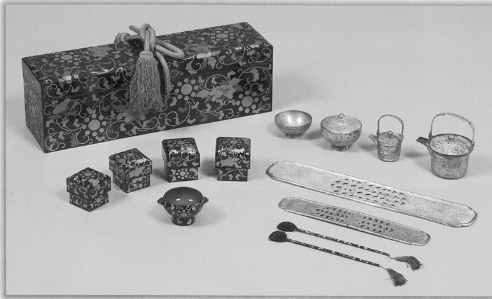
わたしかねばこ 牡丹唐草九曜紋蒔絵渡金箱 お歯黒の道具が収められています