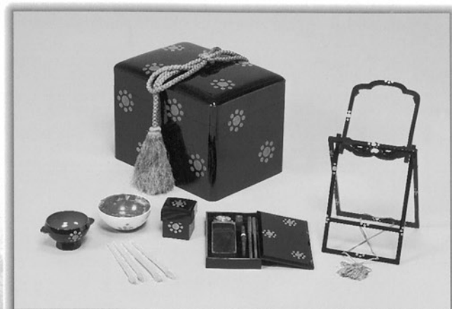
九曜紋散蒔絵旅櫛箱