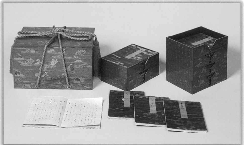
菊花流水蒔絵書箱・源氏物語 源氏物語を収める箱です

江戸時代、大名家同士が婚礼関係を結ぶ際、多いときには数百件もの嫁入り道具を整えました。それらの道具類は同じ意匠やきらびやかな装飾に、家紋を施した揃えで製作されており、大名道具の中でも特に婚礼調度と呼ばれています。それらは大名家の女性の暮らしに必要な生活用品や家具を揃えたもので、香道具や化粧道具など、女性ならではの道具や今では見られないものも含まれています。現存する婚礼調度は当時の婚礼や女性の生活について知ることができる貴重な資料だといえるでしょう。