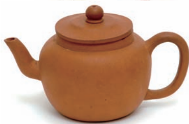
徳川吉宗所用素焼土瓶