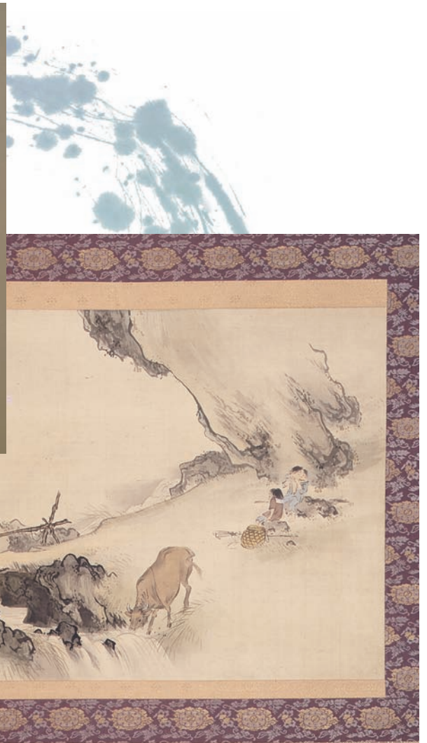
⑳ 柴田是真筆 牧童の図