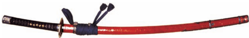
しゅいろかわづつみさやはんだちこしらえ 朱色革包鞘半太刀拵

その中で今回は越前松平家伝来の品を紹介します。大名の指料としてふさわしい、有名刀工の手になる刀や、細密な装飾を凝らした豪華な刀装を、その由緒とともにご紹介します。