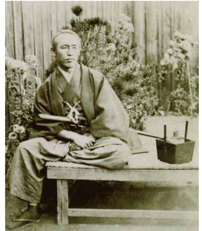
福井藩士の子孫に伝来した坂本龍馬の写真(個人蔵)

龍馬にとってよき理解者であった福井藩は、「金(財源の確保)」も「人(有能な人材)」も頼りとなる、まさに「打ち出の小槌」のような存在でした。本展は、福井市と高知市の観光交流の大きなきっかけとなった、「龍馬と福井」との関係を紹介するものです。