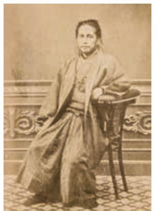
勝海舟肖像写真