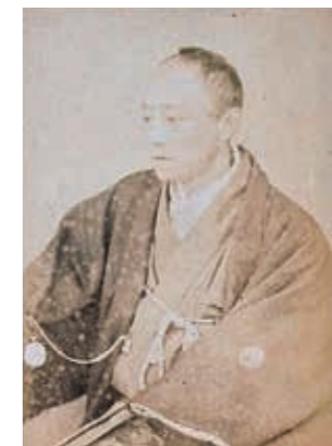
山内容堂肖像写真