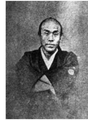
由利公正肖像写真