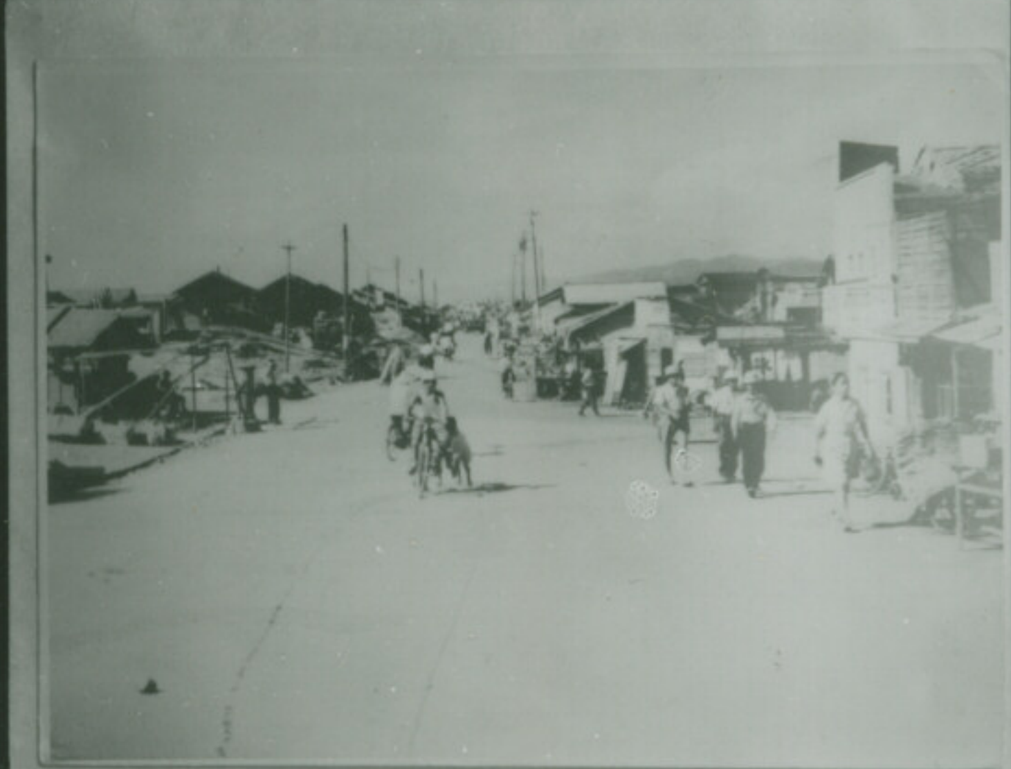
FUJI SAFETY NE