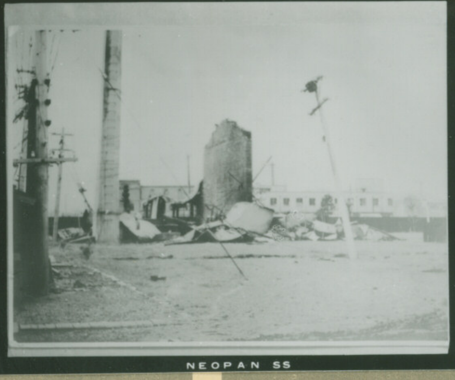
④ 絞 F E1-5-35 秒 Focus Second