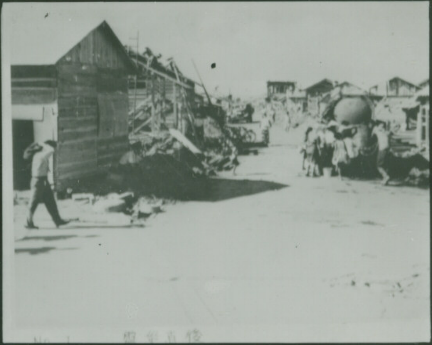
NEOPAN SS FUJI SAFETY