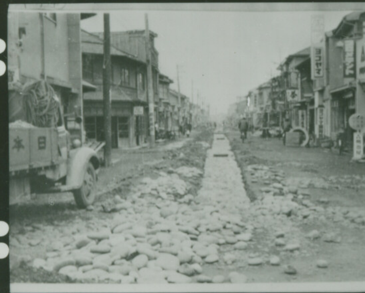
NEOPAN SS FUJI SAFETY