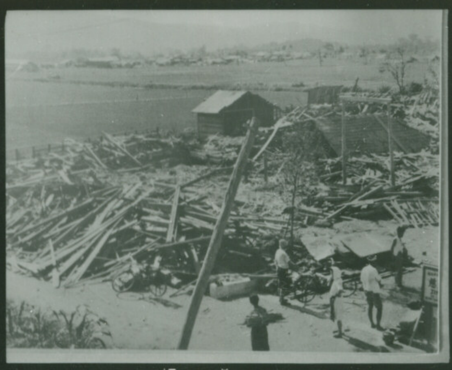
④ 絞 F E1-4-27 秒 Focus Second