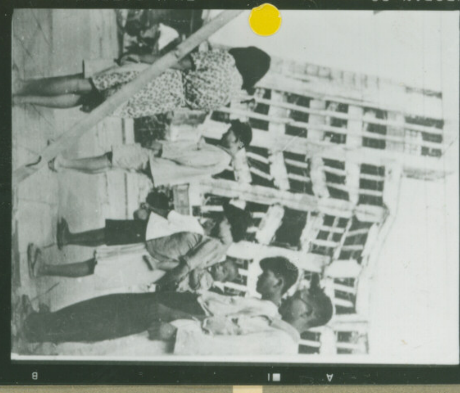
⑦ 絞 F E1-2-13 秒 Focus Second