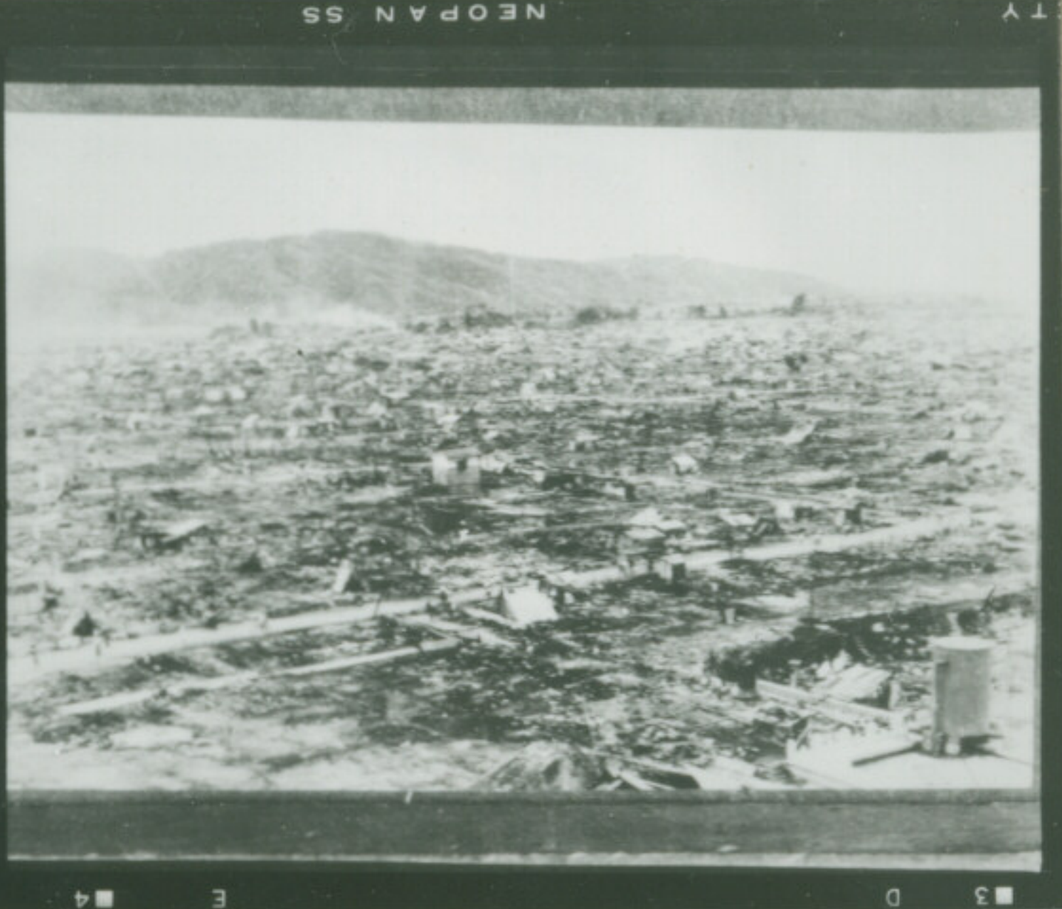
⑩ 絞 F EI-8-63 秒