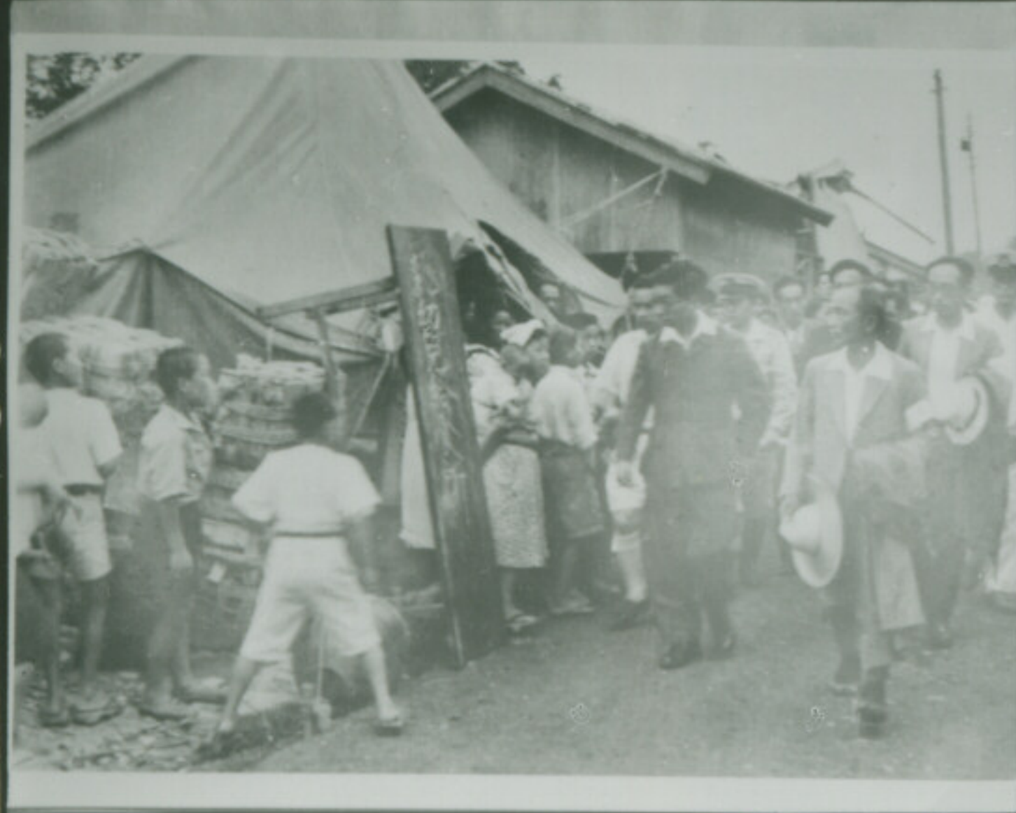
PAN SS FUJI SAFETY