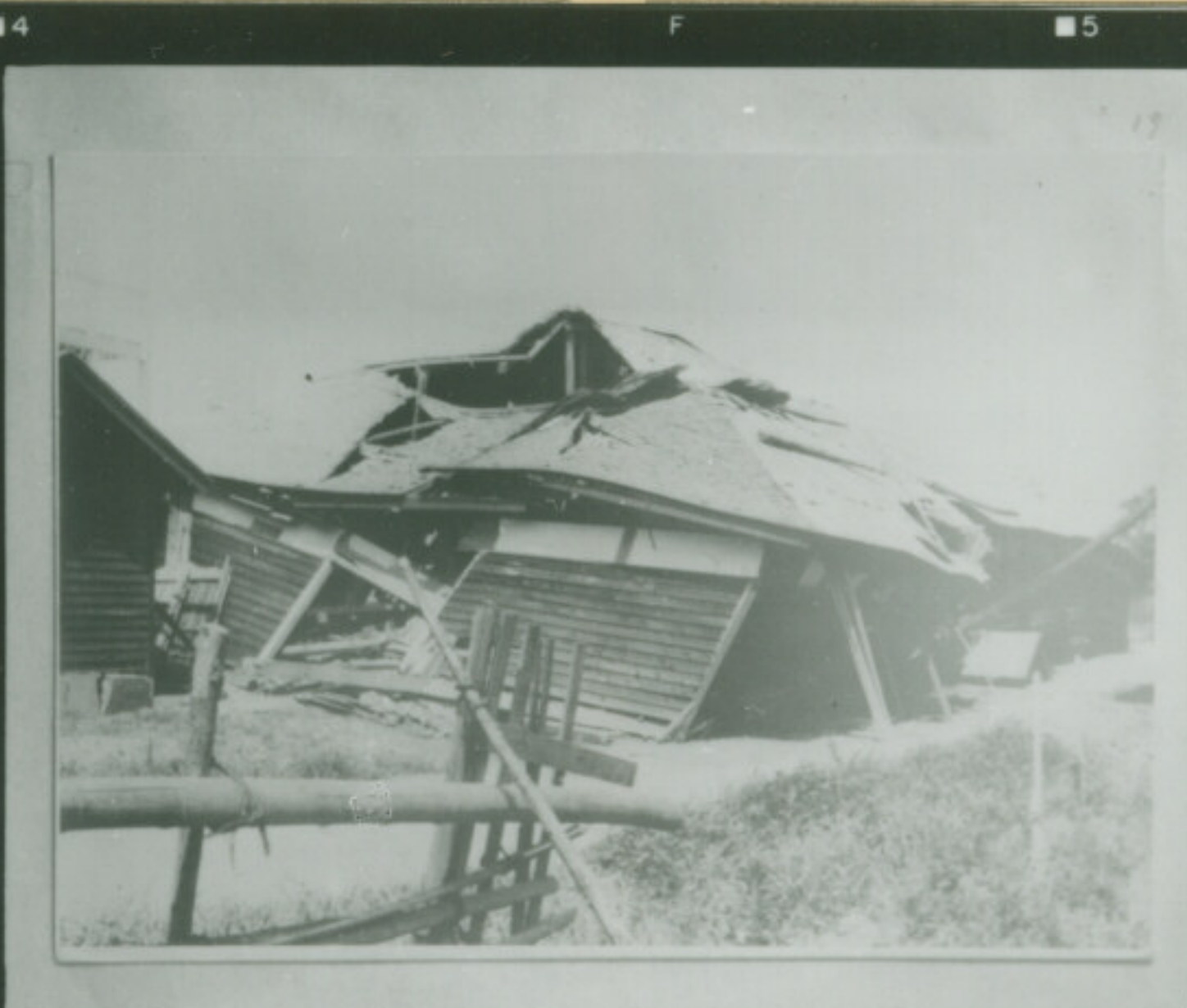
⑩ 絞 F EI-7-55 秒