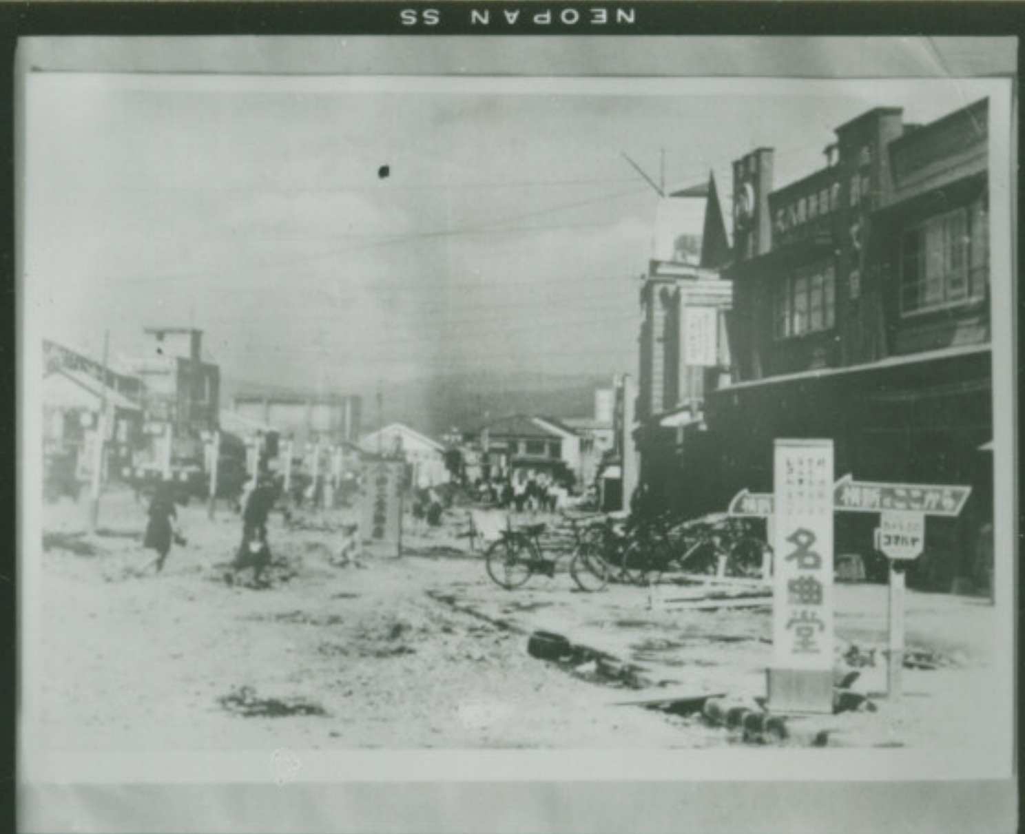
⑩ 絞 F E1-10-79 秒 Focus Second