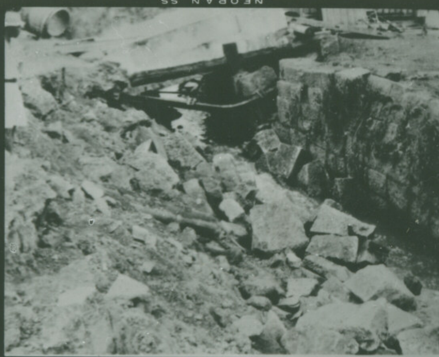
⑥ 絞 F Focus Second