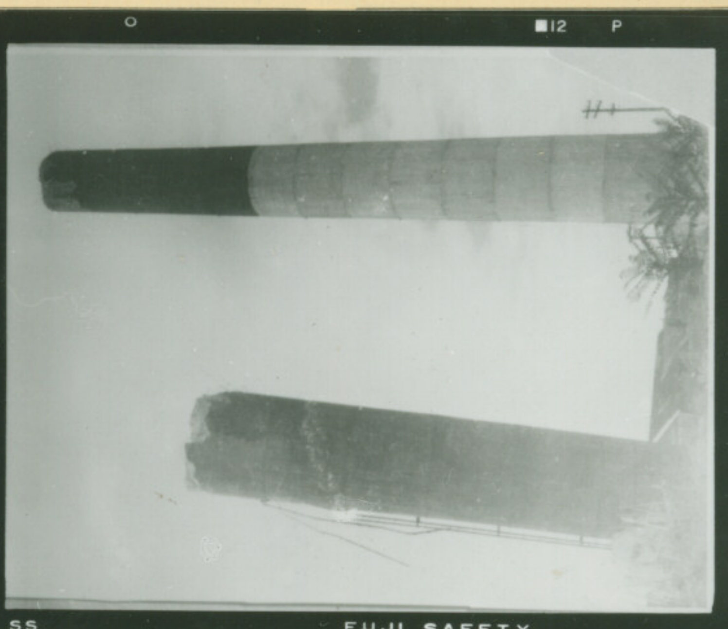
⑦ 絞 F E1-5-37 秒 Focus Second