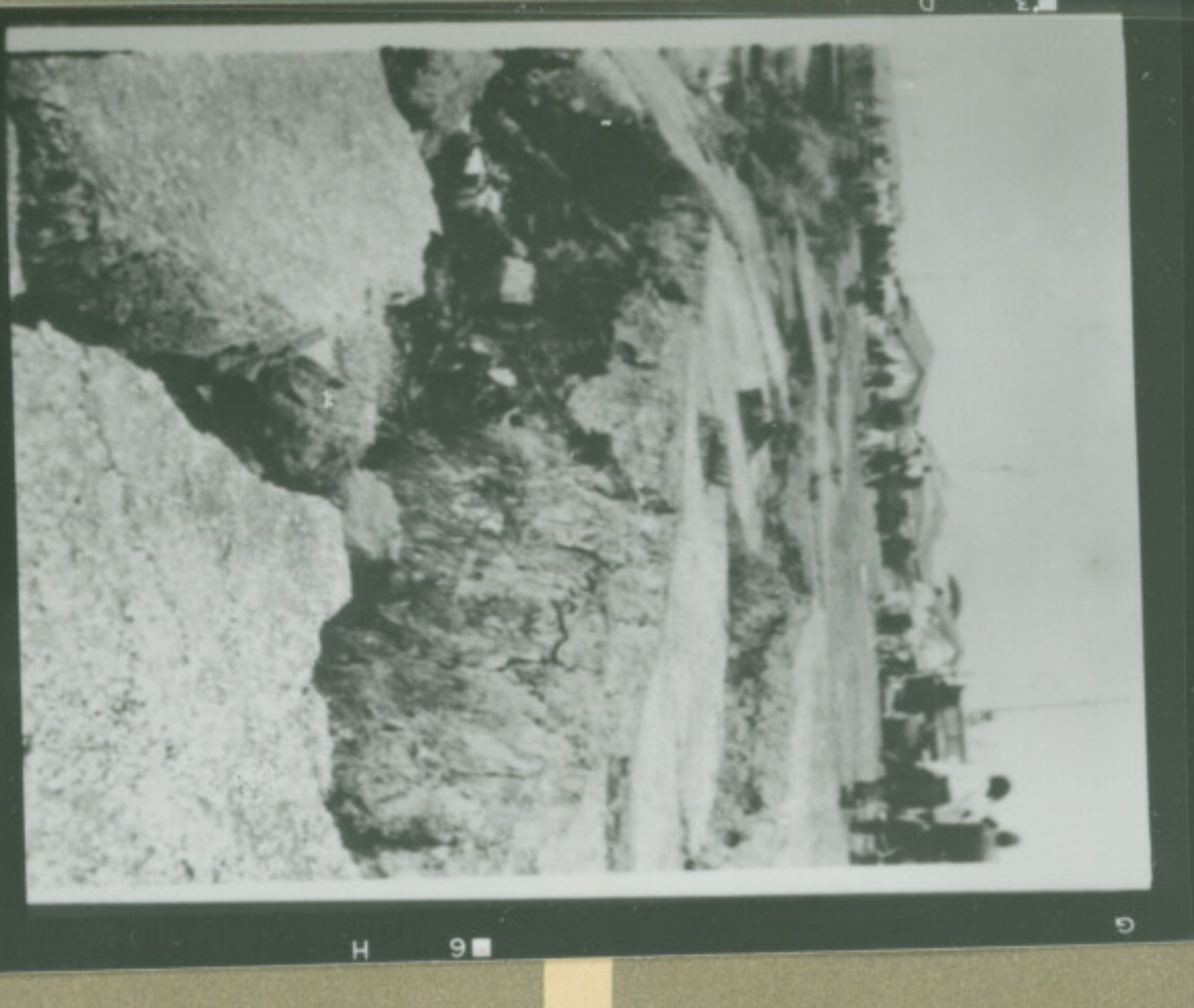
① 絞 F EI-7-49 秒 Focus Second