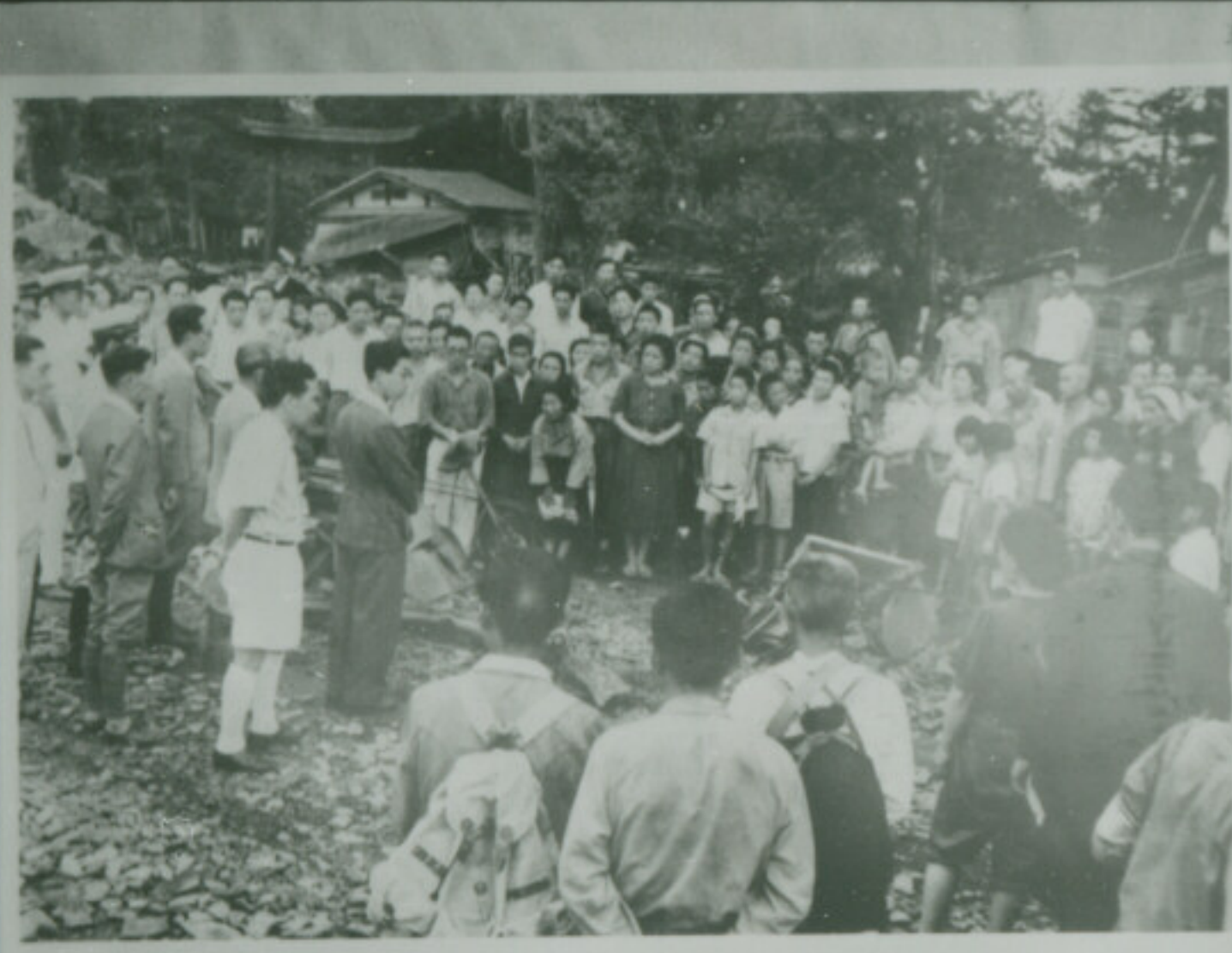
FUJI SAFETY NEOPAN SS