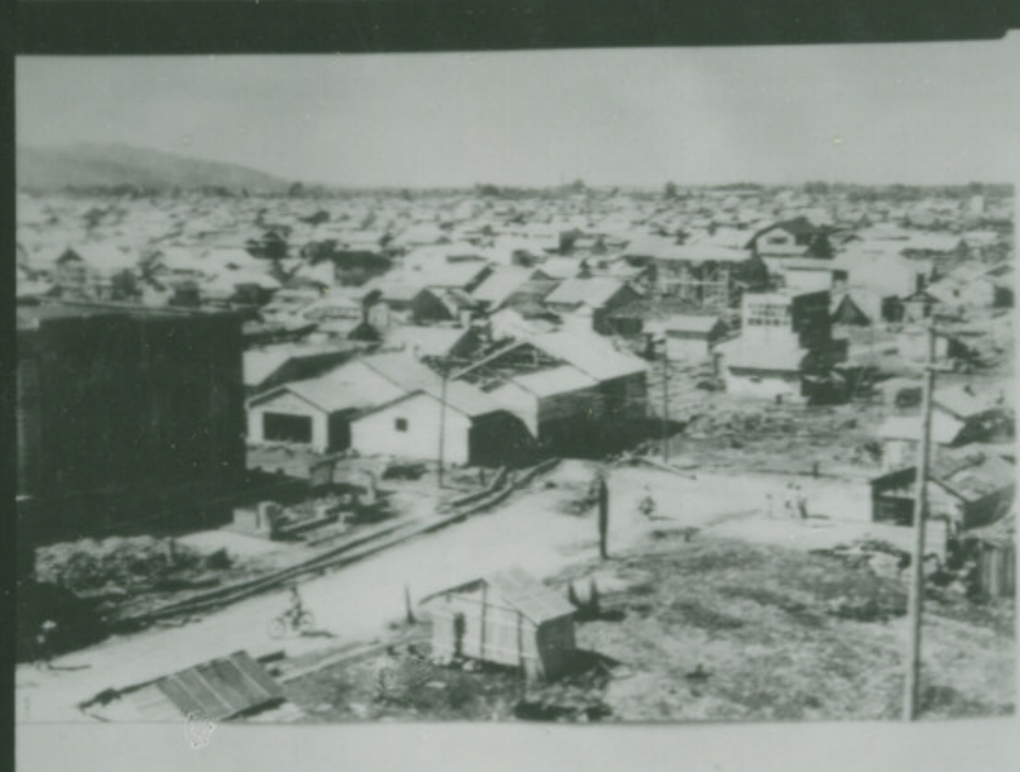
NEOPAN SS FUJI SAFETY