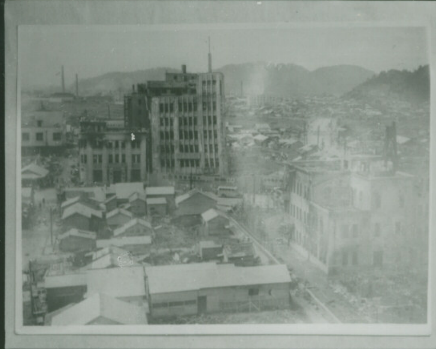
NEOPAN SS FUJI SAFETY